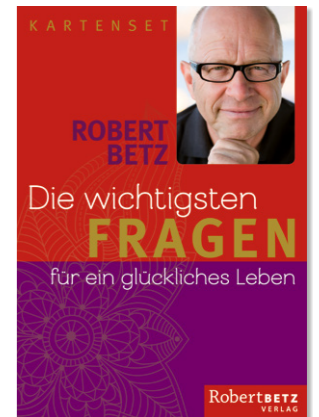
BEST-SELLER BETZ, ROBERT Die wichtigsten Fragen für ein glückliches Leben